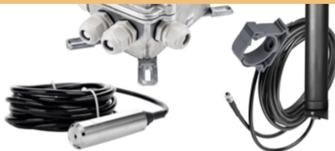
Рис. 2. Комплект «Датчик уровня гидростатический PROMODEM GSM 830.05»