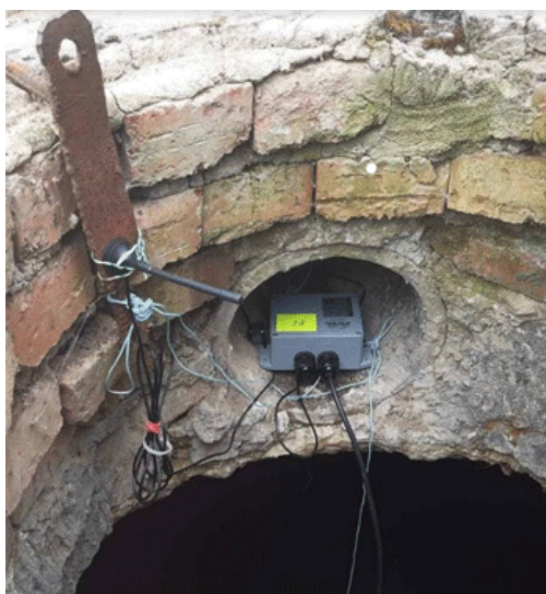
Рис. 1. Узел контроля уровня воды в резервуаре на базе Zulu-датчика (логгера) PROMODEM

Комплект для гидрогеологического мониторинга « Датчик уровня гидростатический PROMODEM GSM 830.05 » имеет водозащиту IP68 и допускает недельное затопление (рис. 2).